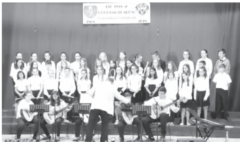
Öszinte, gyönyörű éneklés Szeredában – feltámadó gyermekkórus-mozgalom?