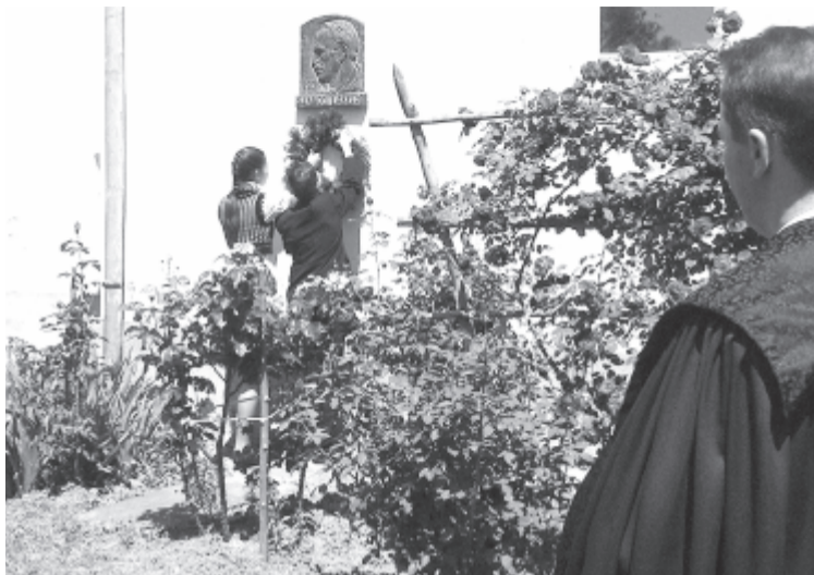
Huszonhét éve megszakítás nélkül emlékeznek a szabédiak Szabédra.

1991-ben kezdődött el a Szabédra való emlékezések sorozata, évente kétnapos ünnepséget szerveztek a szabédiak és az Erdélyi Magyar Közművelődési Egyesület: Kolozsváron tudományos rendezvényekre került sor, megkoszorúzták Szabédi László sírját a Házsongárdi temetőben, és a Lázár utcai háznál is tisztelgtek, míg másnap Szabédon a „népies” része következett kulturális műsorral és koszorúzással – tudtuk meg a lelkésztől. Néhány éve azonban magukra maradtak a szabédiak, de azóta is ünnepeket, igaz, szerényebben, legtöbbször az egyházközség keretén belül. „Szabédi László felvette a falu nevét, és erkölcsi kötelességünk ezt a szálát