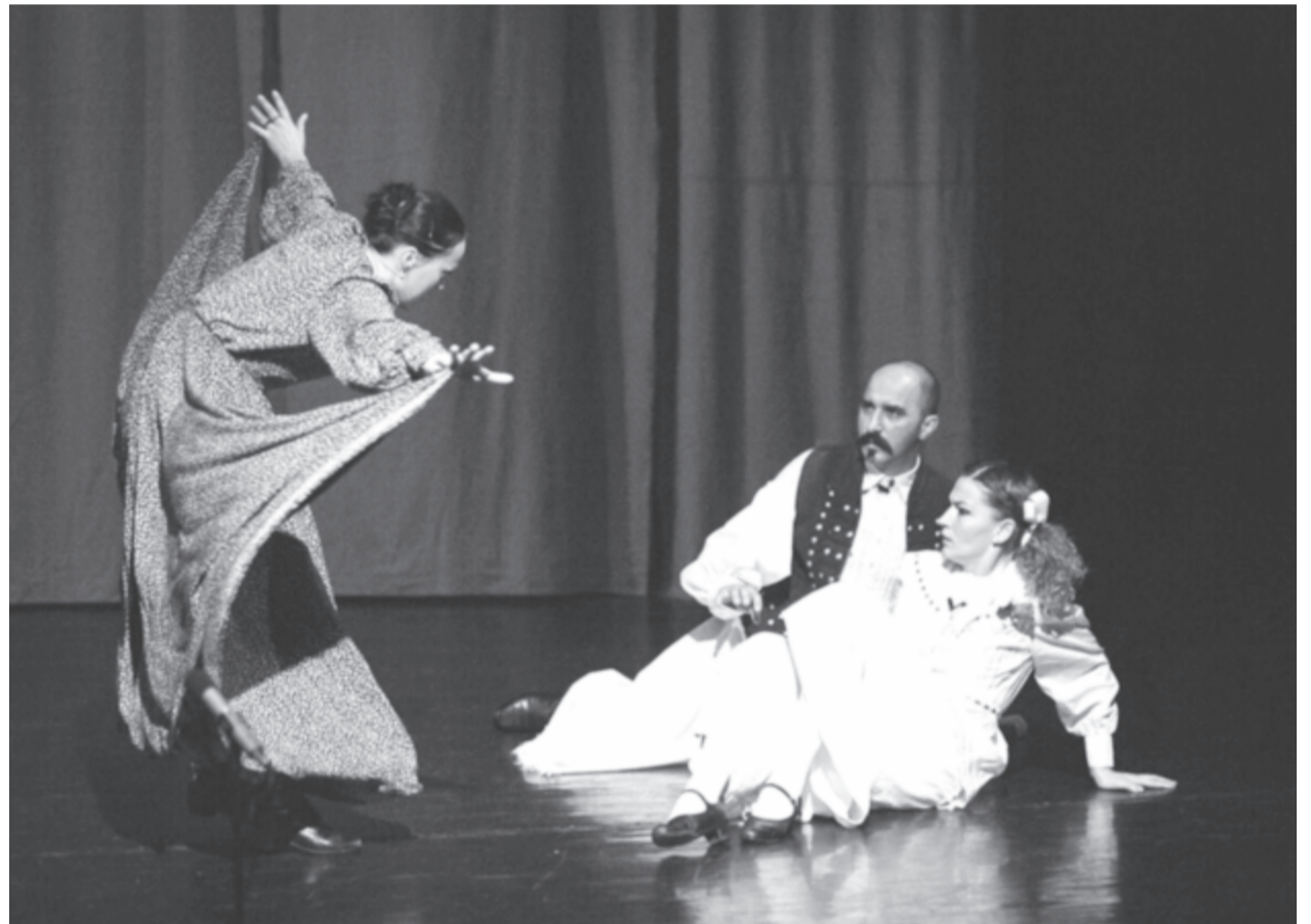
Jelenet a János vitéz című előadásból (illusztráció)